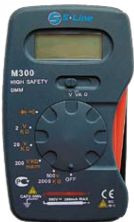
M300 Универсальный цифровой мультиметр. Интегрированные щупы.