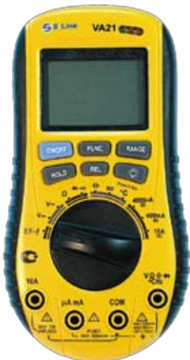
VA21 Универсальный цифровой мультиметр с бесконтактным датчиком напряжения.