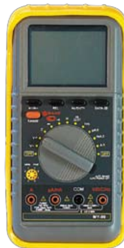
MY99 Универсальный цифровой мультиметр.