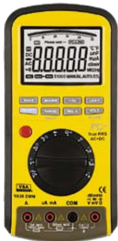
VA38 Универсальный цифровой мультиметр. Высокая точность, подключение к ПК, аналоговая шкала.