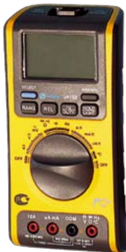
VA18 Универсальный цифровой мультиметр с USB интерфейсом.