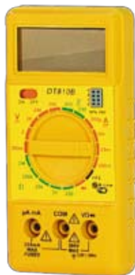
DT810B Универсальный цифровой мультиметр. Миниатюрная модель.