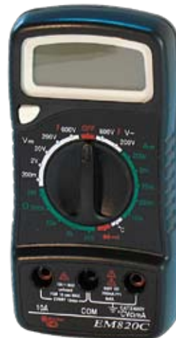
EM820C Универсальный цифровой мультиметр.