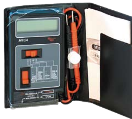
M93A Универсальный цифровой мультиметр. В виде записной книжки.