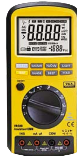
VA588 Универсальный цифровой мультиметр. Тест изоляции 1000 В.