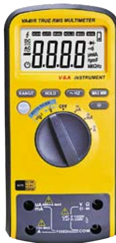
VA41 Универсальный цифровой мультиметр. "Smart" сам определяет параметр.