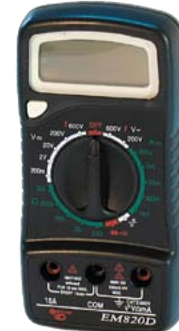
EM820D Универсальный цифровой мультиметр. В форме щупа.