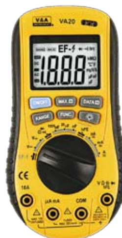
VA20 Универсальный цифровой мультиметр с бесконтактным датчиком напряжения.