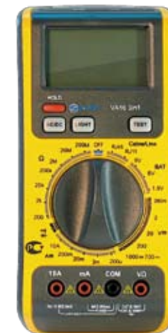
VA16 Универсальный цифровой мультиметр с тестером телефонного и сетевого кабеля.