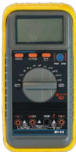
MY68 Универсальный цифровой мультиметр.