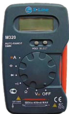
M320 Универсальный цифровой мультиметр. Интегрированные щупы.