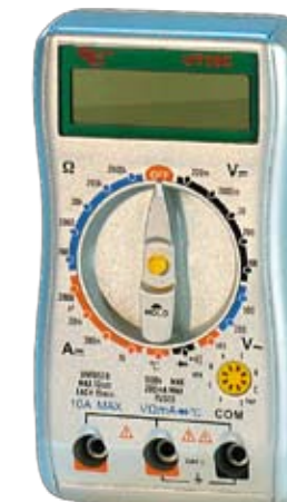
UT30C Универсальный цифровой мультиметр.