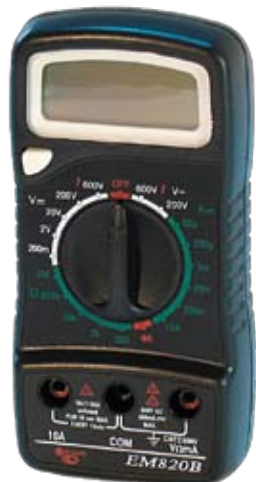
EM820B Универсальный цифровой мультиметр.