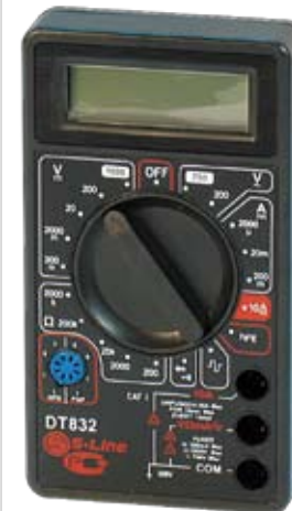
DT832 Универсальный цифровой мультиметр.