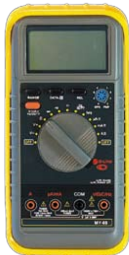
MY69 Универсальный цифровой мультиметр.