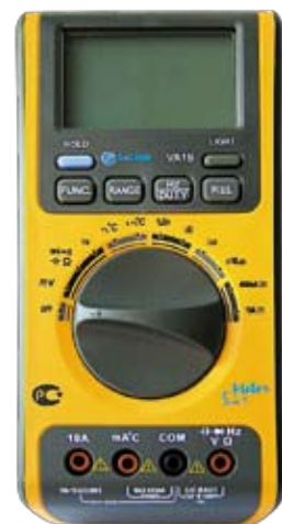
VA19 Универсальный цифровой мультиметр 5 в 1 (шум, освещённость, влажность).