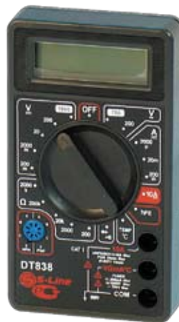
DT830C/DT838 Универсальный цифровой мультиметр.