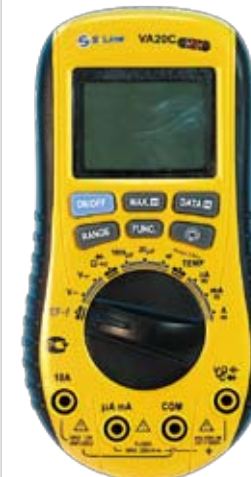
VA20C Универсальный цифровой мультиметр с бесконтактным датчиком напряжения.