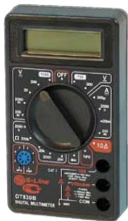
DT830B Универсальный цифровой мультиметр.